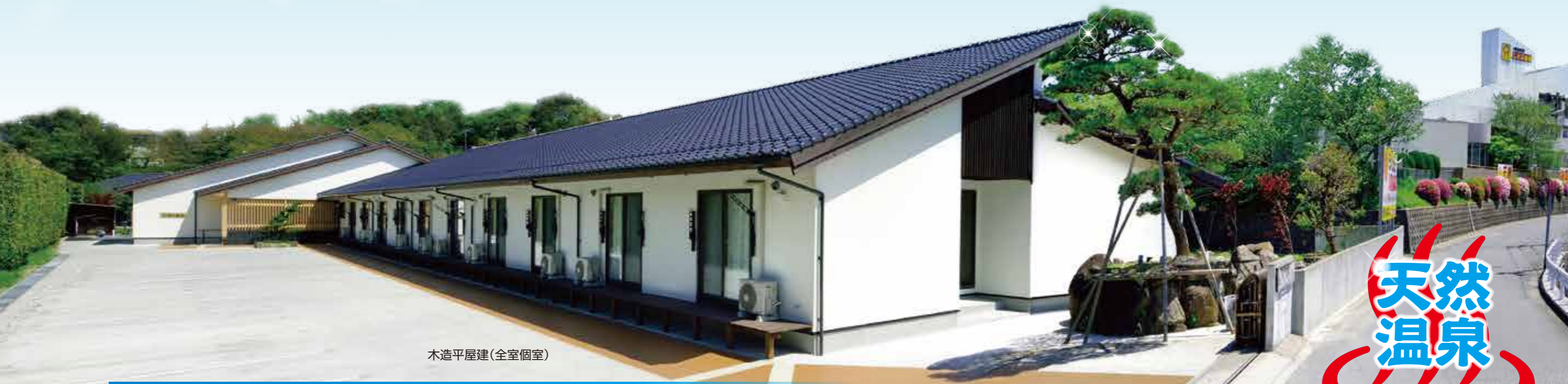
木造平屋建(全室個室)